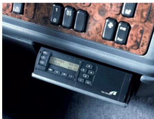
Grundig-Gerät, Einbau in einen DIN-Schacht.