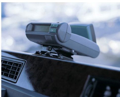
Siemens-Gerät, wird auf dem Armaturenbrett angebracht.